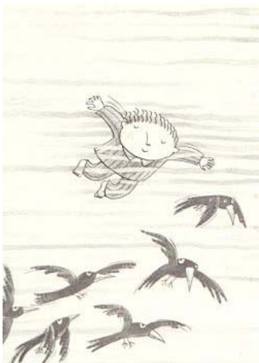
Ilustración de Teresa Novoa para Si ves un monte de espumas y otros poemas .

La antóloga ha agrupado los textos escogidos en dos secciones: "Poesía para el día" y "Poesía para la noche", según los momentos en que son susceptibles de ser leídos. Y este curioso criterio sirve a la artista Teresa Novoa para hacer un maravilloso trabajo de ilustración.